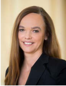
Dr. in Sonja Hammerschmid

Ein wesentliches Ziel der Bildungsreform ist es, allen Kindern einen guten Start in ein gemeinsames Schulleben zu ermöglichen. Das gelingt nur, wenn man die vielfältigen Interessen und Begabungen sobald wie möglich erfasst, Freude und Neugier der Kinder auf die Schule anspricht und direkt an die Entwicklungs- und Lernprozesse aus dem Kindergarten anschließen kann.